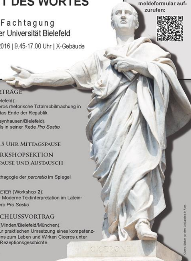
Das aktuelle Programm.

Änderungen vorbehalten. Bielefeld im Juli 2016.