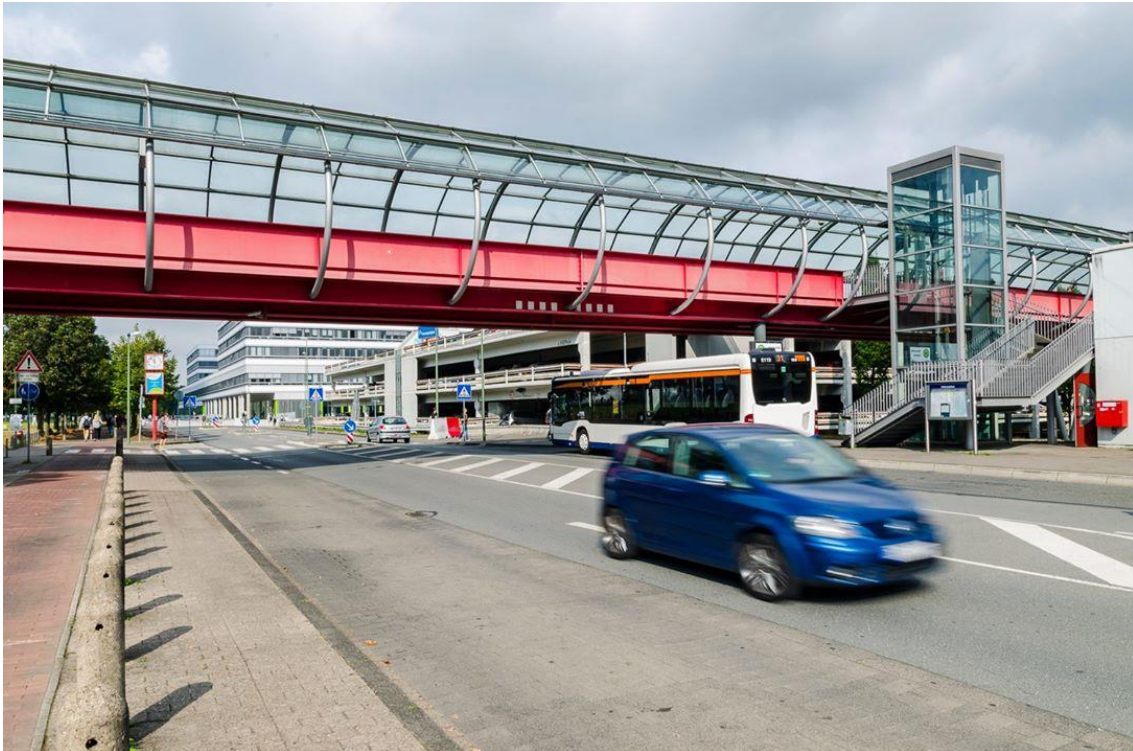
Anfahrt: rechts und links der Brücke befinden sich die Parkhäuser 2 und 3. Hinten rechts ist Gebäude X.