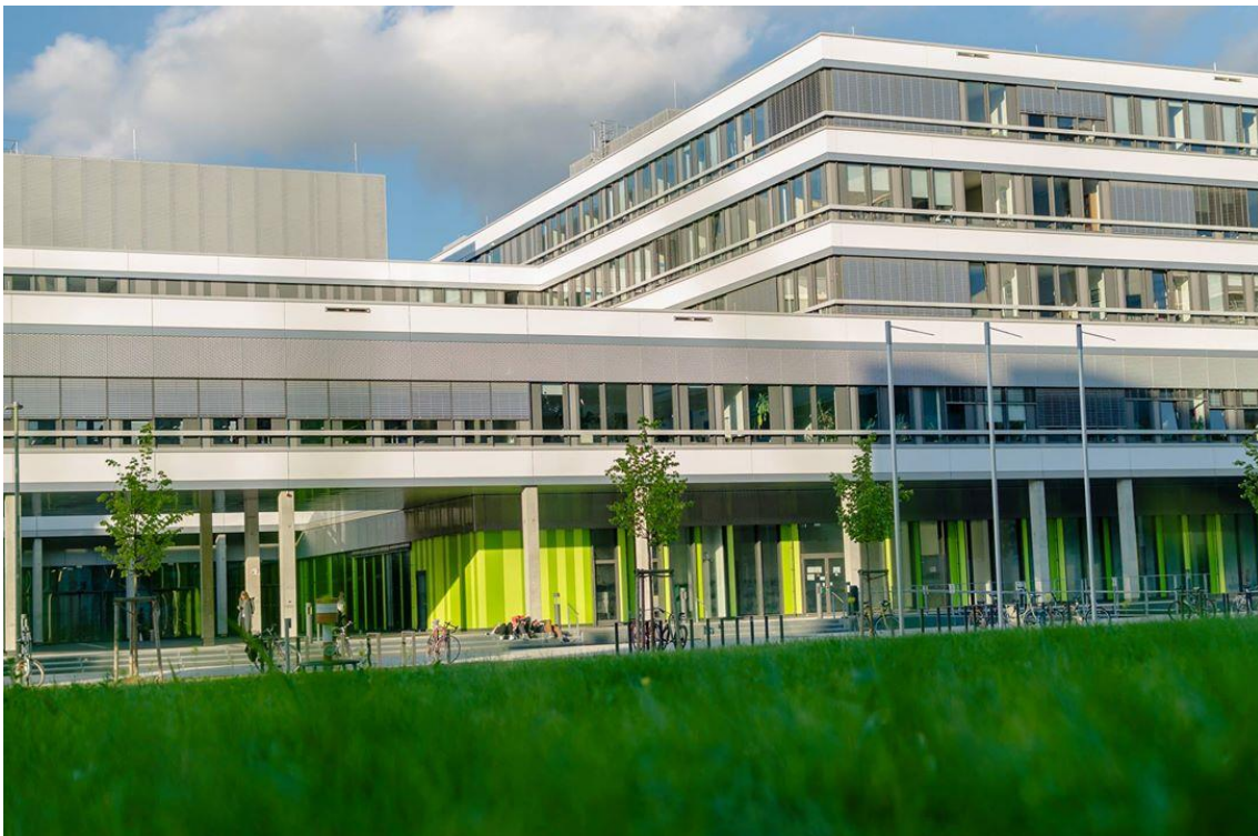
Das Gebäude X der Universität Bielefeld: Links im Bild erkennen Sie den Haupteingang mit vorgelagertem Atrium-Hof.